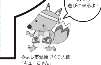
みよし市健康づくり大使 「キューちゃん」

みよし市 赤十字奉仕団 (災害用非常食) JAあいち豊田 助け合いの会三好支部 (製作体験) JAあいち豊田 助け合いの会三好支部 (パンの販売) 三好女声 コーラス (アイスクリームの販売) みよし市身体障害者 福祉協議会 (スーパーボールすくい) 湯楽会 危険害虫駆除グループ (ポップコーンの販売) エスプールのラス (事業紹介) 豊田保護区保護司会 みよし支部 (薬物乱用防止PR) ボーイスカウト みよし第1団 (ロープ結びにチャレンジだ) ボーイスカウト みよし第2団 (ロープ結びにチャレンジだ) ガールスカウト (作ってみよう!) いきいきクラブ みよし連合会 (スタンプラリー受付) ひだまりのつどい グリーングランディーズ 一休さんの会 (会場案内)