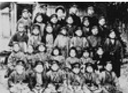
三好学校の卒業生（明治29年）