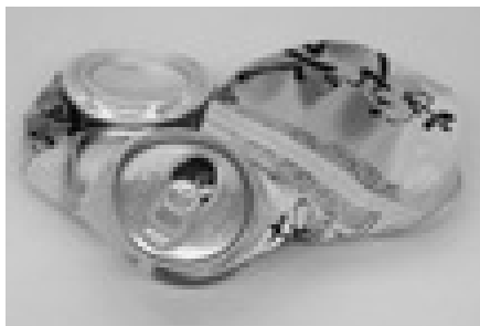
【アルミ缶はつぶして。地区の資源回収ではつぶさないでご注意ください】