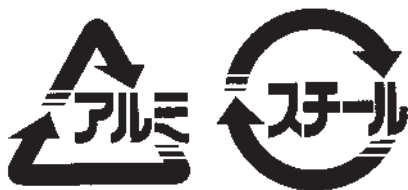
【アルミマーク(左)とスチールマーク】

アルミマーク、またはスチールマーク入りの、飲食料用のものに限り。中をすすいで、アルミ缶はつぶして、スチール缶はそのまま出してください。