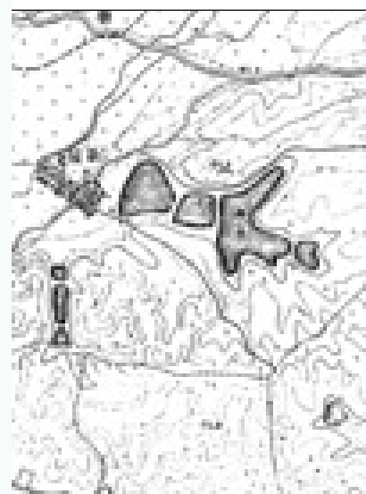
東側から新池、曲り池、中池、下池

昭和32年9月17日には、地主や地元民への用地買収についての説明会が行われました。しかし、当時は用地買収価格の補償基準がまだ確立していなかったため、土地代金の金額決定は保留したまま、代金を概算払いすることで合意。工事着工の承認をなんとか得ることができました。そして、昭和32年11月1日、工事請負