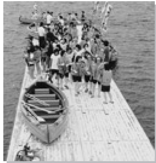
交流が広がる乗船場