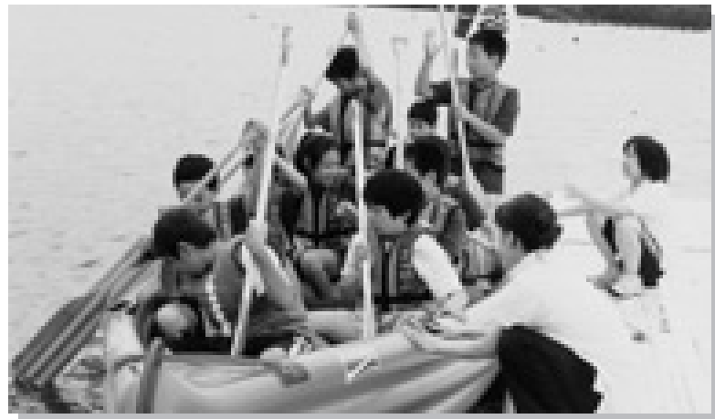
ライフジャケット(救命胴衣)を着用して乗船

保田ケ池でカヌーポロを練習している仲間同士で出場しました。Eボートは、子どもから大人まで、みんなで気楽に楽しみながら乗ることができる所がいいと思います。みんなで声を掛け合っ てこぎ、優勝できてうれしいです。