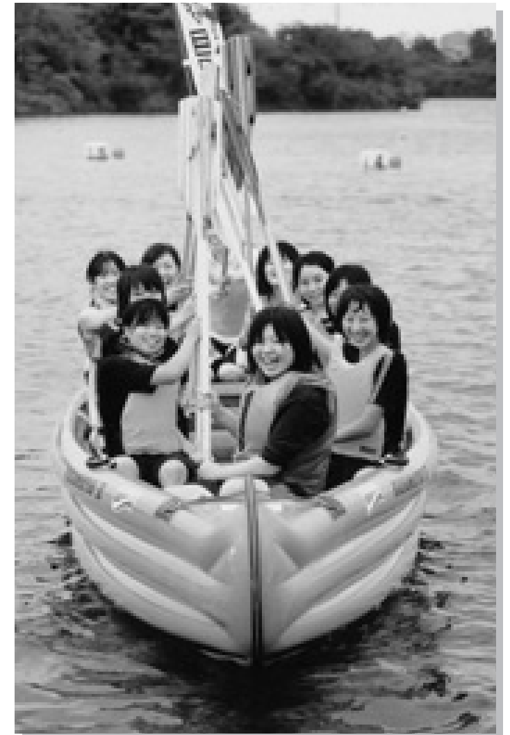
パドルを挙げてよろこびを表す(三好カヌークラブ)