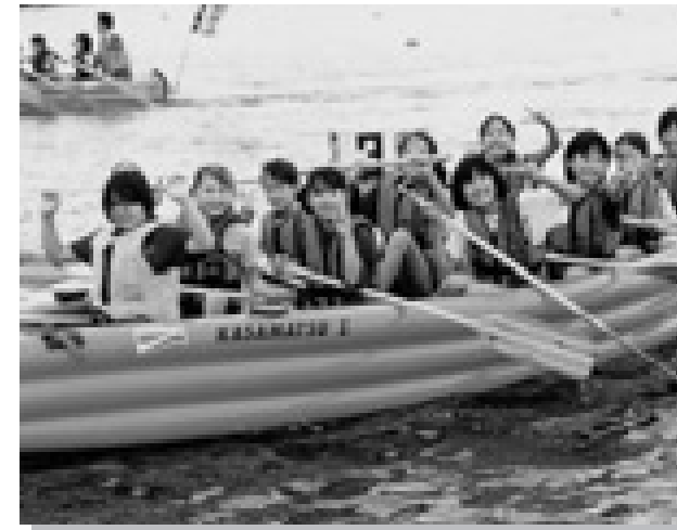
楽しかった(三好ジュニアカヌークラブ 葡萄)