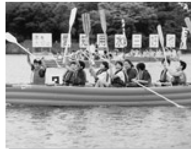
勝った!(三好ジュニアカヌークラブ 梨)