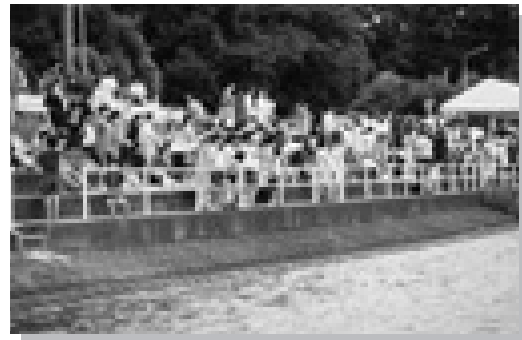
盛んに声援を送る観客