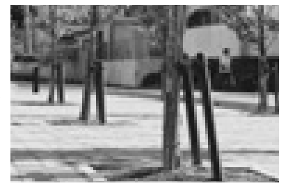
リサイクル材を利用した道路