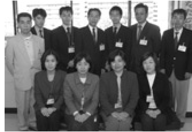
学校教育課の職員（前列右から2人目が今瀬課長）