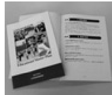
三好町教育基本計画を策定