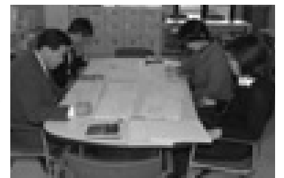
仕事の打ち合わせを行う職員

きたよし地区の人口の増加に対応するため、平成18年4月にきたよし地区中学校を、平成19年4月には黒笹地区小学校を開校する予定で建設準備を進めています。今後も学校教育課では、三好町を担う人づくりのために、教育施策の推進を図っていきたくと考えています。皆さまの協力をお願いします。