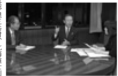
町長と打ち合わせを行う職員

●友好の森ふれあいツアー 町内を流れる愛知用水の水源保全を目的に、平成11年に友好の森として長野県三岳村の30.3haの森林を購入。今年9月20日には、この森の間伐体験などを通して自然と親しみ、水源地への理解を深めるため、友好の森ふれあいツアーを実施しました。ツアーには小学生から60歳以上の人まで、27人が参加。秘書課の職員も町長とともにツアーに参加し、参加者の皆さんと一緒に、木々の間伐を行いました。このツアーは今後も続けていきたいと考えていますので、ぜひ多くの皆さんに参加していただきたいと思ひます。