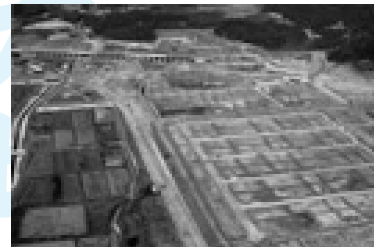
昭和62年の三好ヶ丘

三好ヶ丘ニュータウン開発の対象となった、昭和30年代後半の福谷地区と高嶺地区は、米や野菜などを栽培する農村地帯でした。しかし、昭和40年代後半に入ると、工業化が進むなか、生産を中止する農家の増加や後継者不足から、今後どのように農地を開発していくか、地元では頭を悩ませていました。また同じころ、豊田加茂広域行政圏（現在の豊田加茂広域市町村圏事務処理組合）のし尿処理施設（砂川衛生プラント）の建設計画が浮上。地元から反対意見が上がり、「このままでは地域の開発に期待できない」と心配されました。このようななか、昭和47年に名鉄豊田新線の建設が決定。これを起爆剤にしようと地元では、将来展望のある土地利用を望み、し尿処理場建設を受け入れる条件として、この北部地域の開発を豊田加茂広域行政圏に要望しました。