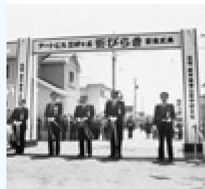
昭和63年の街びらき

北部地域の開発計画は、すでに民間の開発業者によって進められていました。しかし乱開発の防止を図るため、町と地域が検討を重ねた結果、住宅・都市整備公団（現在の都市基盤整備公団）による公的開発を進めることで決着。開発への大きな一歩を踏み出すことになりました。