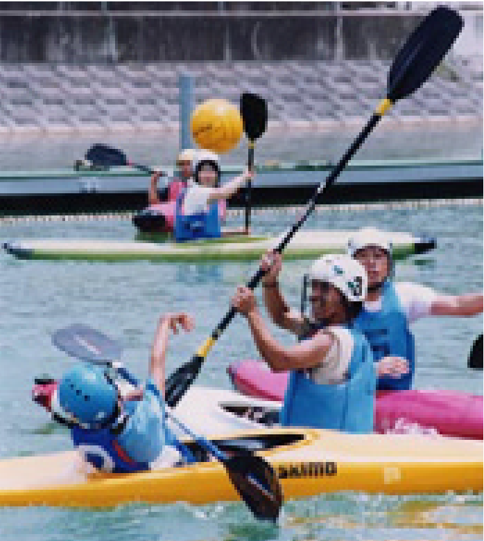
白熱した展開を見せた町民カヌーポロ大会

健康づくりと地域・世代間の交流を進めるため、なかよし地区で設立される総合型地域スポーツクラブを支援していきます。 ③世界カヌーポロ選手権大会の開催 本年7月21日から25日までの5日間、保田ヶ池カヌーポロ競技場で、2004