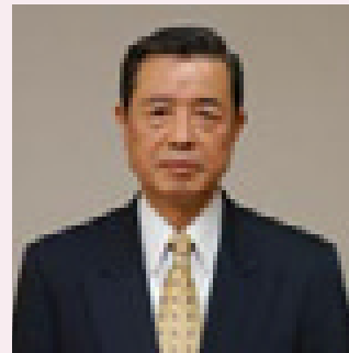
公職歴 昭和39年4月～ 愛知県事務吏員 平成11年4月～ 同企業庁管理部長事務課長 平成13年4月～ 同足助事務所長 平成14年4月～ 同豊田加茂事務所長