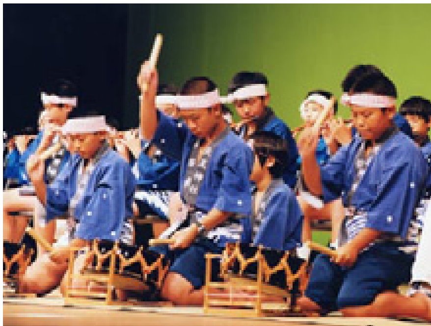
真剣な表情で郷土芸能伝承活動に取り組む子どもたち

また教育学習センターの機能を生かし、生涯学習の専門機関として、少子高齢化、国際化、高度情報社会に対応していきます。そして、三好町が目指す将来の都市像「ゆとりと活気ある ふれあいのまち」の実現に向けて、教育学習センターを拠点に子ども講座、情報活用学科、専門講座など、さまざまな講座を開催していきます。