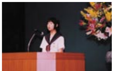
少年の主張三好町大会を担当

● 青少年係の仕事 明日の三好町を担う青少年の健全な育成を図るため、いろいろな活動を行っている三好町青少年健全育成推進協議会。青少年係はこの協議会の事務局として、少年の主張三好町大会の開催や非行防止への取り組み、家族みんなのふれ合いを深める、毎月第3日曜日の「家庭の日」の啓発活動を行っています。また地区のジュニアクラブへの支援や補導員、こころの電話相談の相談員の協力を得ながら、青少年の健全育成に努めています。