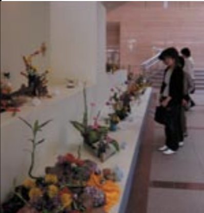
文化活動の発表の場として、春と秋に開催する文化展

● 社会教育課とは 生涯学習をはじめとする社会教育活動や中央公民館の管理、青少年の健全育成、女性団体への支援などの仕事を男性5人と女性4人の職員が社会教育係、青少年係、男女共同参画係の3つの係に分かれて行っています。 ● 社会教育係の仕事 町民の皆さんに自主的に学習活動を進めていただくこと、平成14年3月に策定した三好町生涯学習推進基本計画。この計画に基づいて中央公民館、明越会館での生涯学習講座や地域で自主的に取り組まれる学習活動、子育てを支援する「いきいき子育て講座」など、町民の皆さんの学習機会の充実に努めています。また学習成果を発表するため、文化展や生涯学習発表会、公募美術展の開催を担当するほか、町民の文化意識を高め、文化芸術に