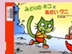
「みどりのネコとあかいワニ」 ブノア・ドウベック/作 及川 美枝/訳

ももんちゃんがおフロに入っていると、きんぎょさんが入ってきて「あ〜ごらくごらく」。それからみんなが入ってきて…。あれ、ももんちゃんがびんびんのびんく色に。