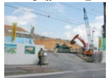
きたよし地区で建設が進む新中学校

6つの特別会計の決算額は、歳入74億7,164万円、歳出70億2,030万円となりました。前年度と比較すると歳入6億9,596万円、歳出4億8,534万円の増加となりました。