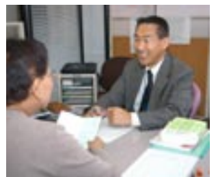
年金相談は毎週水曜日に実施

● 医療係 75歳以上(一部65歳以上)の人を対象にした老人保健に関わる業務のほか、就学前までの乳幼児を対象にした乳幼児医療、18歳以下の子どもがいる母子(父子)家庭の父母や児童などを対象にした母子家庭等医療、障害者の障害者医療などの助成を行っています。また生涯現役で生活できるよう、高齢者を対象に健康と生きがいづくりにも努めています。