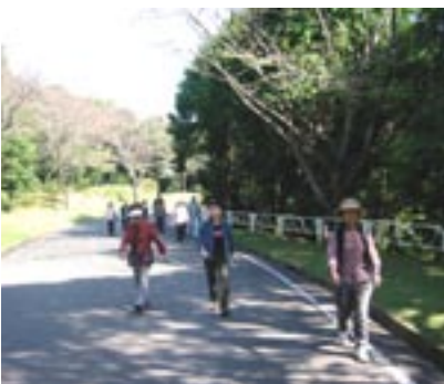
健康と生きがいづくりのためのウォーキング(10月)

● 国保係 日本ではすべての人が医療保険に加入することになっています(国民皆保険)。そこで、農業や自営業など職場の健康保険に加入できない人を対象とするのが国民健康保険です。国保係では、この国民健康保険の資格取得や喪失、医療給付、国民健康保険税の課税や徴収など、国民健康保険に関する業務を行っています。また健康づくり事業の1環として、加入者を対象とした「健康づくり教室」も開催しています。