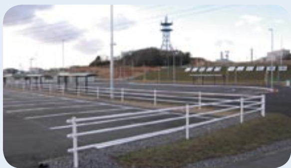
東名三好インターチェンジに隣接するパーク・アンド・ライド駐車場には1,500台が駐車可能です。また町の観光案内所と特産品の展示販売所も開設されます。

愛知万博においてパーク・アンド・ライド駐車場は、全国各地・世界各国から訪れる人々との最初の交流の場。駐車場ではおもてなしボランティアスタッフが駐車場を利用する皆さんを、おもてなしの心で温かくお迎えます。バス乗り場の案内誘導や高齢者・障害者のサポート、美化清掃活動などを行います。