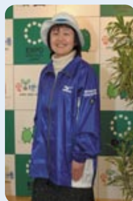
おもてなしボランティアスタッフのユニフォーム