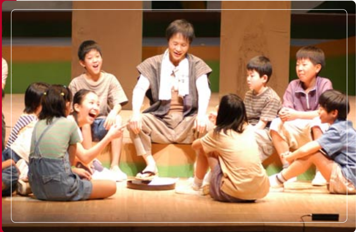
※写真は、昨年度の「秀じいと山の子たち」の公演