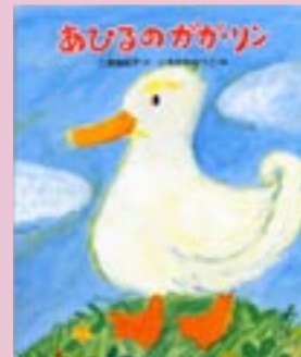
『あひるのガガーリン』 一宮由紀子/文 いちかわなつこ/絵

ママに「夕ごはん何がいい？」って聞かれたから「カレーライス！」って答えたんだ。それを聞いたまちの人もみんな、なんだかカレーライスが食べたくなってきちゃって…。