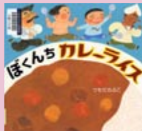
『ぼくちカレーライス』 つちだのぶこ/作

ホームページ( http://www.hm8.aitai.ne.jp/~miyosi-l/ )で新着図書の検索ができます。