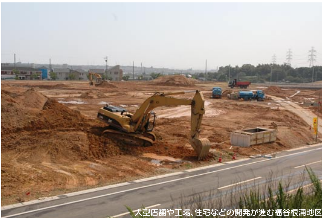
大型店舗や工場、住宅などの開発が進む福谷根浦地区

平成17年度中に特定開発事業の開発計画書を受け付けた件数は、66件（詳細は次頁の表参照）。このうち取り下げが5件、手続きを終えて開発事業に関する工事が完了し、検査済証を交付したのは12件で、残りの49件は事業進行中です。また処理状況の詳細は下表のとおりです。