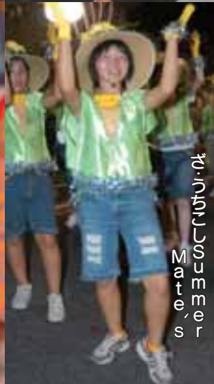
キーンカッソウズ Mate's