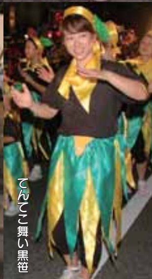
てんてこ舞い黒笹