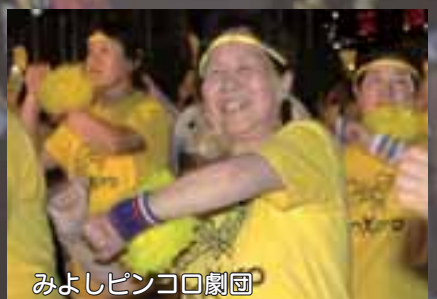
みよしピンコロ劇団

三好の夏の風物詩、第15回三好いいじゃんまつりが8月25日に三好稲荷間周辺道路で、そして三好大提灯まつりが8月25日(前夜祭)・26日(本祭)の2日間、三好稲荷間で行われました。 いいじゃんまつりには、町内外から色鮮やかできらびやかな衣装を身にまとった50グループおよそ3,300人が参加。オリジナルまつりソング「じゃんだらりん」と「JUST ROLLIN、(ジャストローリン)」の2曲の軽快なリズムに合わせて踊り歩き、会場は熱気に包まれていました。 また大提灯まつりでは、高さ11m、直径6.5mの提灯が夏の夜空に美しく浮かび上がり、たくさんの露店とともに人々を楽しませていました。本祭では、各保存会の皆さんが棒の手やおはやしを奉納。祭りの最後には、およそ