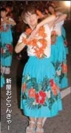
新屋おごらんぎゃー