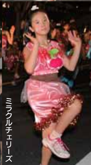
ミラクルチエリーズ