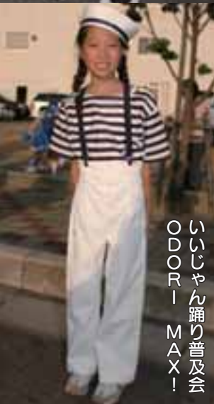
ODDOR-MAX! いいじゃん踊り普及会