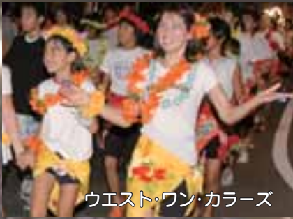
ウエスト・ワン・カラーズ