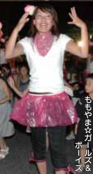
ももやま☆ガールズ& ボーイズ