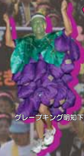
グレープキング明知下

1,000発の花火が打ち上げられ、訪れた人たちは時を忘れ、光の芸術に酔いしれていました。 今回は2つの祭りを、写真で紹介いたします。