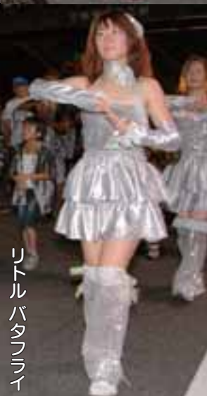
リトルバタフライ