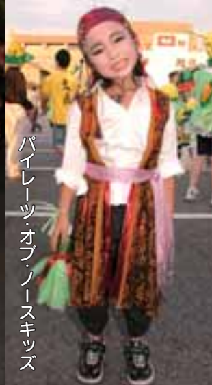
パイレーツ・オブ・ノースキッズ