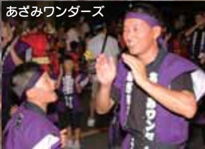
あざみワンダース