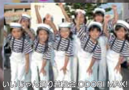
いいじゃん踊り普及会 ODORI MAX!