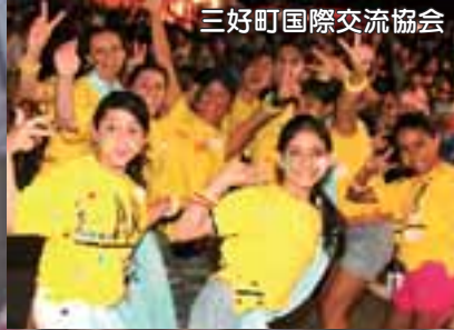
三好町国際交流協会