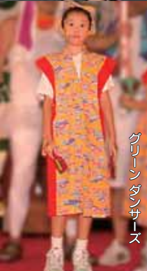
グリーンダンサーズ