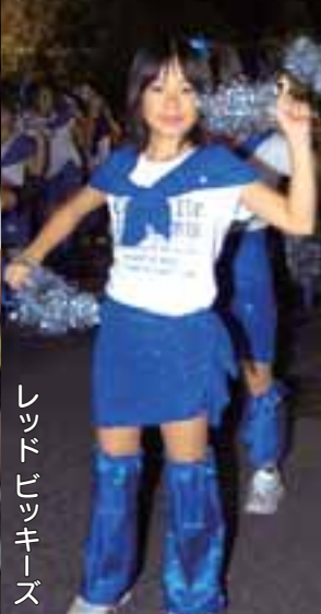
レッドピッキーズ