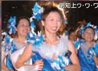
明知上ワ・ワ・ワ