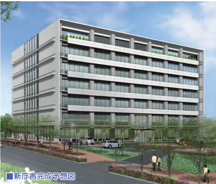
■新庁舎完成予想図

なお、意見および三好町の皆さんの詳細については、三好町ホームページ( http://www.town.aichi-miyoshi.lg.jp/soumu/syomu/pabukomekeka.html )および役場西館1階情報プラザで公表していきます。