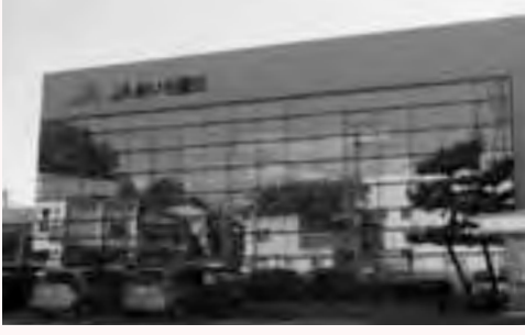
▲現在の外観を生かし、最小限の改装でふれあい交流館として利用します。

「ふれあい交流館」は、市役所の西側にある「Aあいち豊田三好支店」の一部(旧三好町農業協同組合本館部分)を改装して開館します。