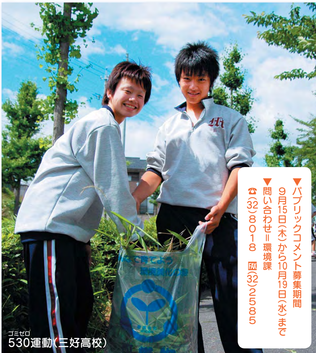
ゴミゼロ 530運動（三好高校）