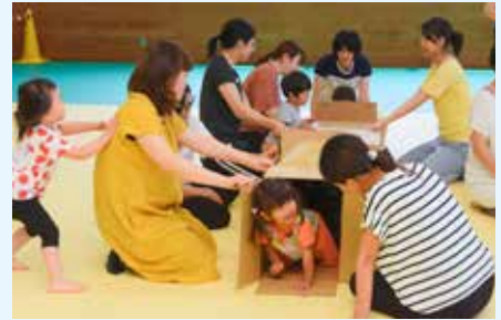
▲幼児の親子体操教室