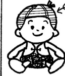
おしゃべり人形 かぼちゃん

このあと購入してみました。 夫は本気で付き合ってしまう事もあ りケレカが 始まることも...びくり です。 使い方がいろいろあり 考之中です。