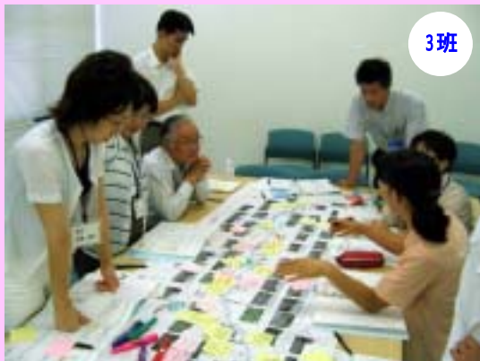
各班の意見交換の様子