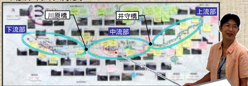
3班のアイデアのまとめ

昔は生活に密着していた境川も、今は排水路のように思われています。草刈りなどの河川の維持管理に住民も取り組めたらよいと思います。生き物や川について学べる場として、ピオトープが欲しいです。魚とりやホテル狩りのような子供がかかわるイベントの場にならないでしょうか。