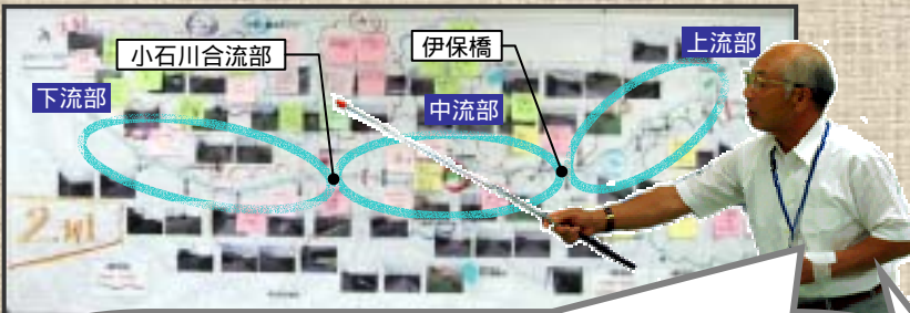
2班のアイデアのまとめ

車の抜け道を歩行者のみの道にすれば安全になります。法面がコンクリートブロックばかりなので、自然石や火山石をつかってはどうでしょうか。