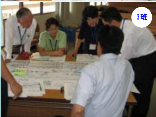
各班の意見交換の様子