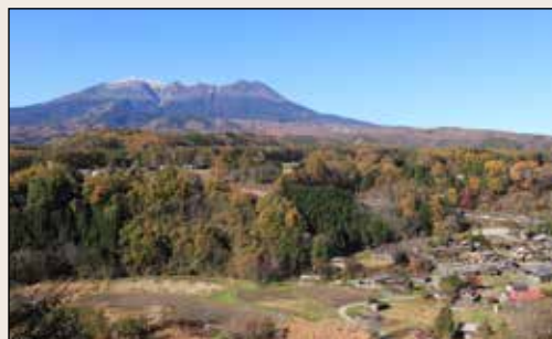
▲木曾町のシンボル御嶽山

木曾町は平成17年11月1日に木曾福島町・日義村・開田村・三岳村の4町村が合併して誕生したまちです。長野県南西部に位置し、総面積の90%を山林が占める緑豊かな山間のまちで、長野県内の町村では最も広い面積を有します。夏と冬、昼と夜の寒暖の差が大きい内陸性気候で、四季折々の自然があふれる「日本で最も美しい村連合」の一つです。