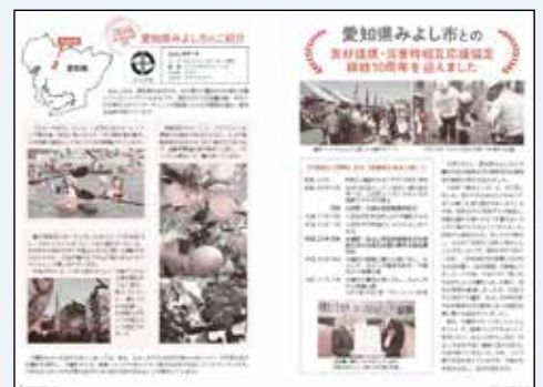
▲広報きそまち11月号