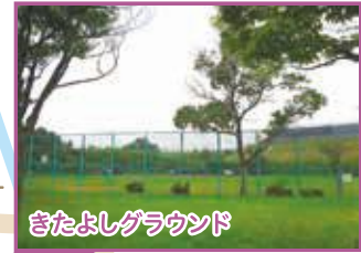
きたよしグラウンド