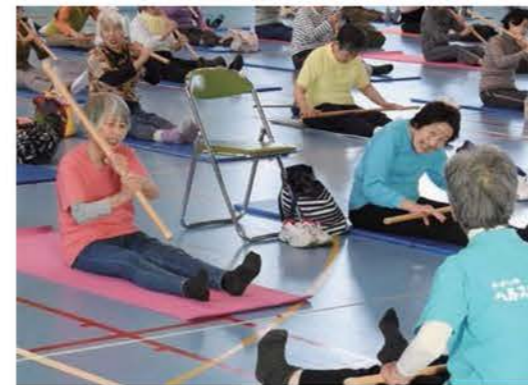
ヘルスパートナーによる「棒体操教室」

市民で構成される「ヘルスパートナー ※1 」や「食生活健康推進員 ※2 」との協働により、「ウォーキング」や「棒体操教室」、「栄養教室」などを開催し、市民の普段からの運動習慣や健全な食生活の実践に対する意識向上を図ります。