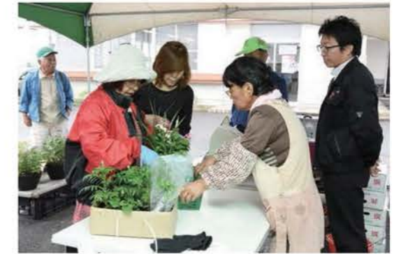
太陽の家で開かれる「シルバー直売会」

高齢者の希望に応じた幅広い職種を開拓するなど、シルバー人材センターの事業の充実・強化を図ります。