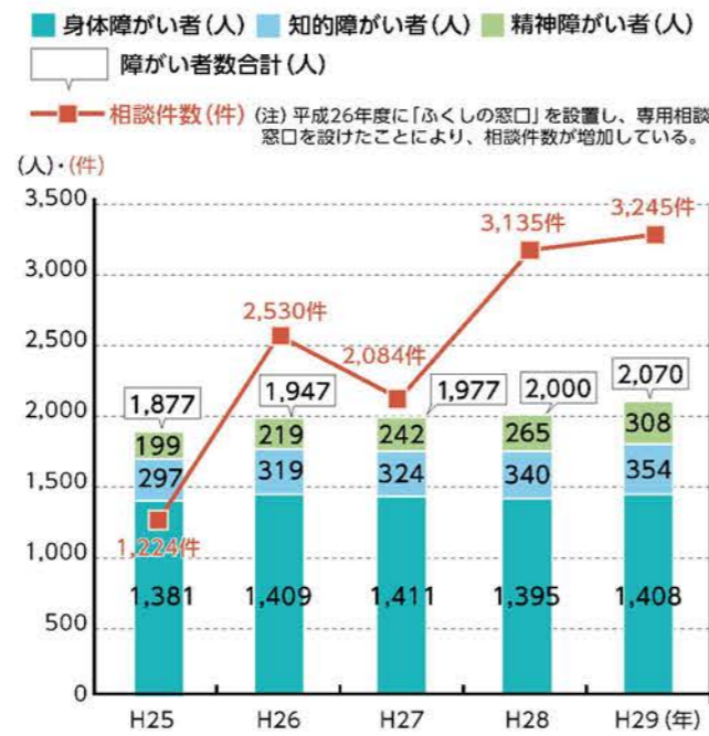
障がい者数(手帳所持者)・相談件数の推移