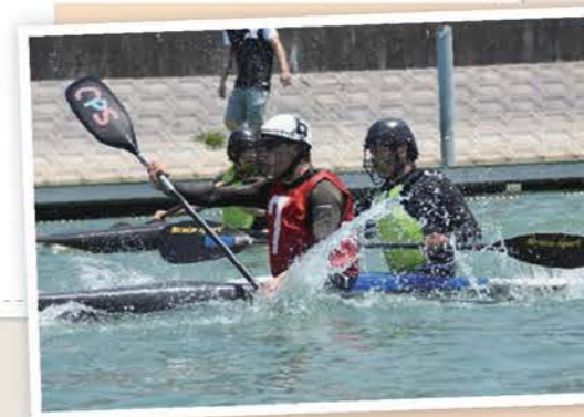
▲保田ヶ池カップカヌーポロ大会 (取組分野：スポーツ)