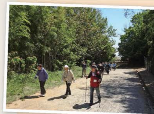
◀ヘルスパートナーによる「史跡めぐりウォーク」 (取組分野：健康づくり)