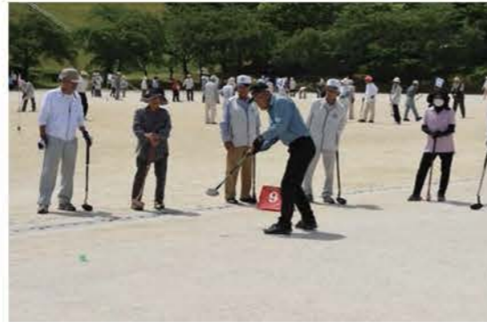
いきいきクラブの会員同士のコミュニケーションを深める「グラウンド・ゴルフ大会」

高齢者の、希望に応じた幅広い職種の開拓、「ふれあい交流」や余暇活動の場の充実を図る必要があります。