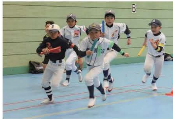
スポーツ少年交流大会

今後は、市民が自主的に自身の適性・健康状態に応じてスポーツを継続的に行うことができるように、引き続きスポーツ団体やスポーツ推進委員会、地区スポーツ委員などが相互に連携しながらスポーツの振興に取り組み、あらゆる世代に対して生涯スポーツを通じた健康づくりの機会を広く提供するため、指導者やボランティアの育成に取り組む必要があります。