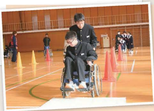
市内中学校における福祉実践教室 (取組分野：障がい者福祉)