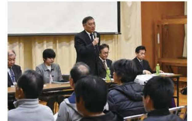
市民の皆さまの声を直接伺う「皆さと語る会」

「皆さと語る会」や「皆さまの提言箱」、パブリックコメント、各種市民アンケートや市ホームページの問い合わせフォームなどを通して、市民の意見や提言を広く収集し、市政運営に反映します。