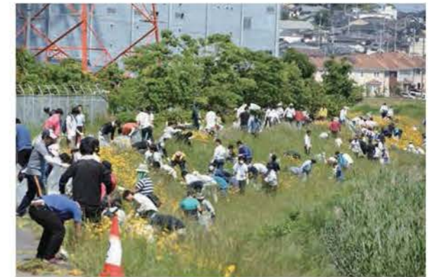
ボランティアによるオオキンケイギク駆除活動

NPO・協働相談窓口を設置し、市民活動の活性化や行政との協働推進を図るとともに、市民活動に関する情報発信や情報交換などを気軽に行うことができる「市民活動サポートセンター」の運営を通し、協働のパートナーの育成を推進します。