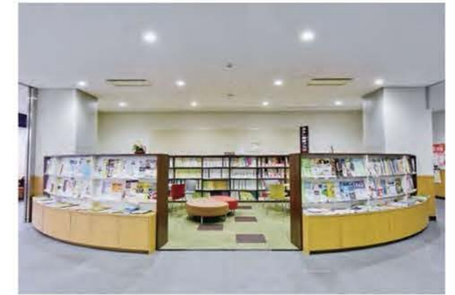
市役所の情報プラザ

行政情報を迅速かつ正確に提供するための行政文書ファイリングシステム ※1 の維持管理に努めます。