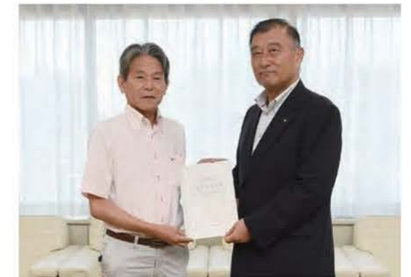
行政評価委員会の結果を市長に報告

毎年度、行政評価を実施し、施策や事務事業を点検評価します。その評価結果は市民に広く公表するとともに、予算に的確に反映させることで、効率的かつ透明性の高い財政運営を行います。