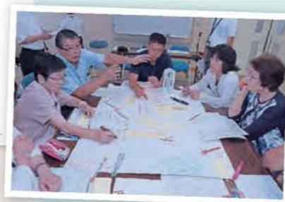
まちづくりを考える市民ワークショップ (取組項目：市民の参画と協働によるまちづくり)