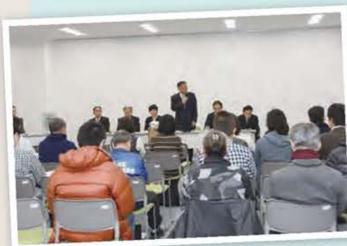
▲皆さまと語る会(取組項目：広報・広聴)