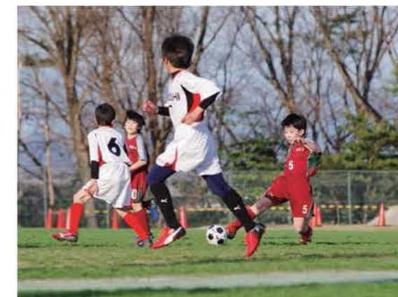
本市と士別市の少年サッカー交流会

本市と士別市の小学生による交流に加え、野球やサッカーなどのスポーツ少年団の交流を通して、両市の自然や文化、風土に触れるとともに、相互交流を深めます。