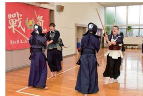
コロンバス市高校生の三好高校体験入学

国際理解講座などを開催し、市民の国際社会への窓口を広げます。また、友好都市であるコロンバス市への中学生派遣や市民などの派遣、さらに、コロンバス市の高校生のホームステイでの受け入れを通して、子どもたちや市民の国際感覚の養成を支援します。