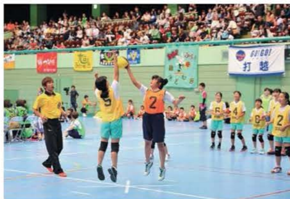
子ども会球技大会

また、子どもたちが成長するとともに「生きる力」を育むためには、地域社会の中で大人やさまざまな年齢の人と共に、生活体験や社会体験、自然体験などを豊富に積み重ねることが重要です。このため、地区子ども会、地区子育てクラブの活動支援や、ジュニアリーダークラブ活動の強化などに取り組み、地域全体で子どもの成長を見守り育てることのできる環境づくりを行う必要があります。