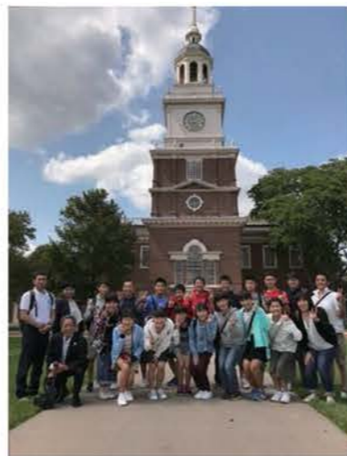
コロンバス市への中学生派遣事業

情報通信技術や交通網などの飛躍的な発展により、世界のどの国とも国際的な結びつきが強くなっています。こうした国際化が進む社会に的確に対応していく人材を育成するために、平成7年2月に友好提携を締結した米国インディアナ州コロンバス市への中学生派遣や、コロンバス市の高校生の受け入れなどを進めています。