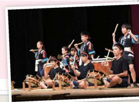
▲郷土芸能伝承活動発表会 (取組分野：文化・芸術)