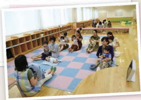
子育てふれあい広場での「読み聞かせ」(取組分野：子育て支援)▶