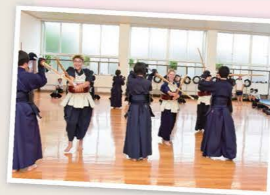
◀友好都市のコロンバス市の高校生が三好高校で剣道を体験(取組分野：多文化共生)