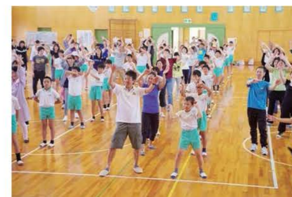
親子で参加する市内小学校での「ふれあい学習会」

小学校区に家庭教育推進協議会を常設し、家庭・学校・地域の連携による「ふれあいトライアングル推進事業 * 」を継続的に実施し、家庭教育の重要性に対する理解を深めてもらうための取り組みの推進に努めます。