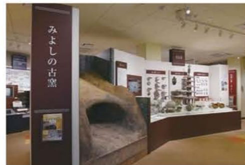
歴史民俗資料館での展示コーナー

市民が今後も文化や芸術、歴史に親しみ、豊かな暮らしにつながるためには、その拠点となる施設の維持管理を行うとともに、各団体への支援や歴史的資源を展示する環境づくりが求められています。