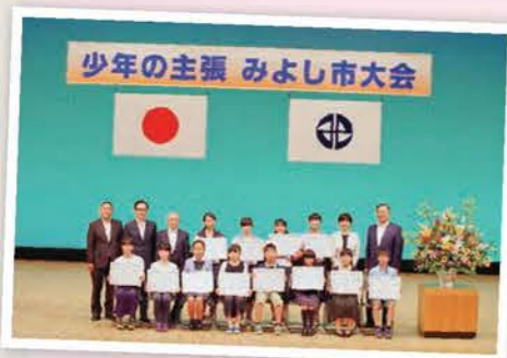
少年の主張大会 (取組分野：青少年健全育成)