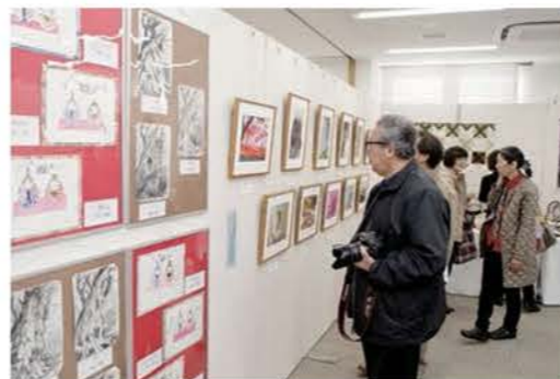
生涯学習発表会(作品展示)

子どもから高齢者まで、全ての世代にとって魅力のある多様な情報を提供する拠点となる「サンライブ」に中央図書館と生涯学習施設を集約したことにより利用者は大幅に増えました。今後は計画的に蔵書を充実させ、さまざまな市民ニーズに対応する必要があります。