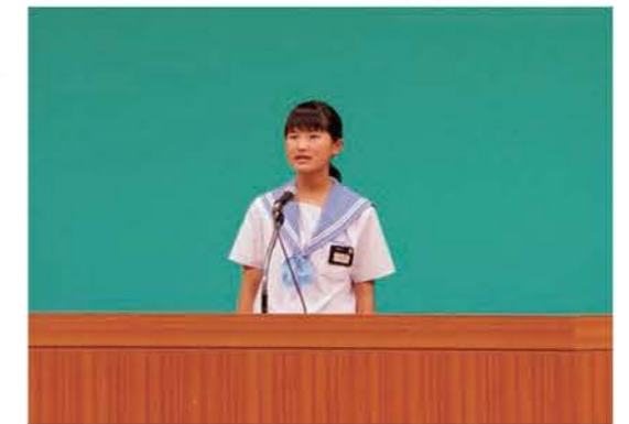
少年の主張で自分の考えを発表する市内中学校生徒

小中学生を対象に日ごろの生活を通して感じていること、実践していることを発表する少年の主張大会を行います。