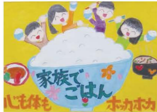
家庭の日ポスター（市内小学校生徒の作品）

そのため、青少年健全育成推進協議会やジュニアクラブなどの地域活動がより活性化するように支援するとともに、青少年の健全育成を推進するため、街頭啓発活動を展開する必要があります。また、地域では、青少年活動の活性化を支援できる人材の育成も必要です。