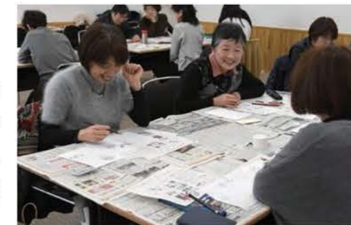
「サンライブ」で開催される生涯学習講座

「サンライブ」で、生活創造や国際理解、情報・通信の各分野の悠学カレッジ講座を、春夏、秋冬、新春の年3期実施するとともに、大学との連携による公開講座や、親子講座を開催し、市民に学習の場を提供します。