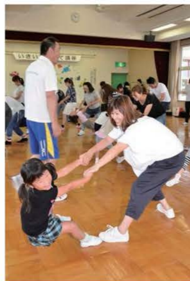
いきいき子育て講座

しかし、各事業への参加者のほとんどは母親であり、父親の参加率の低下や地域との関わりが薄れてきているのが現状です。講座などへの参加者だけでなく、家庭や地域全体で家庭教育に関心を持ち、家庭教育の重要性に対する理解を深めてもらうため、家庭教育に関する情報や、市内各所で開かれる家庭教育に有益な催しに関する情報を、積極的に発信する必要があります。