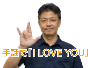
手話で「I LOVE YOU」