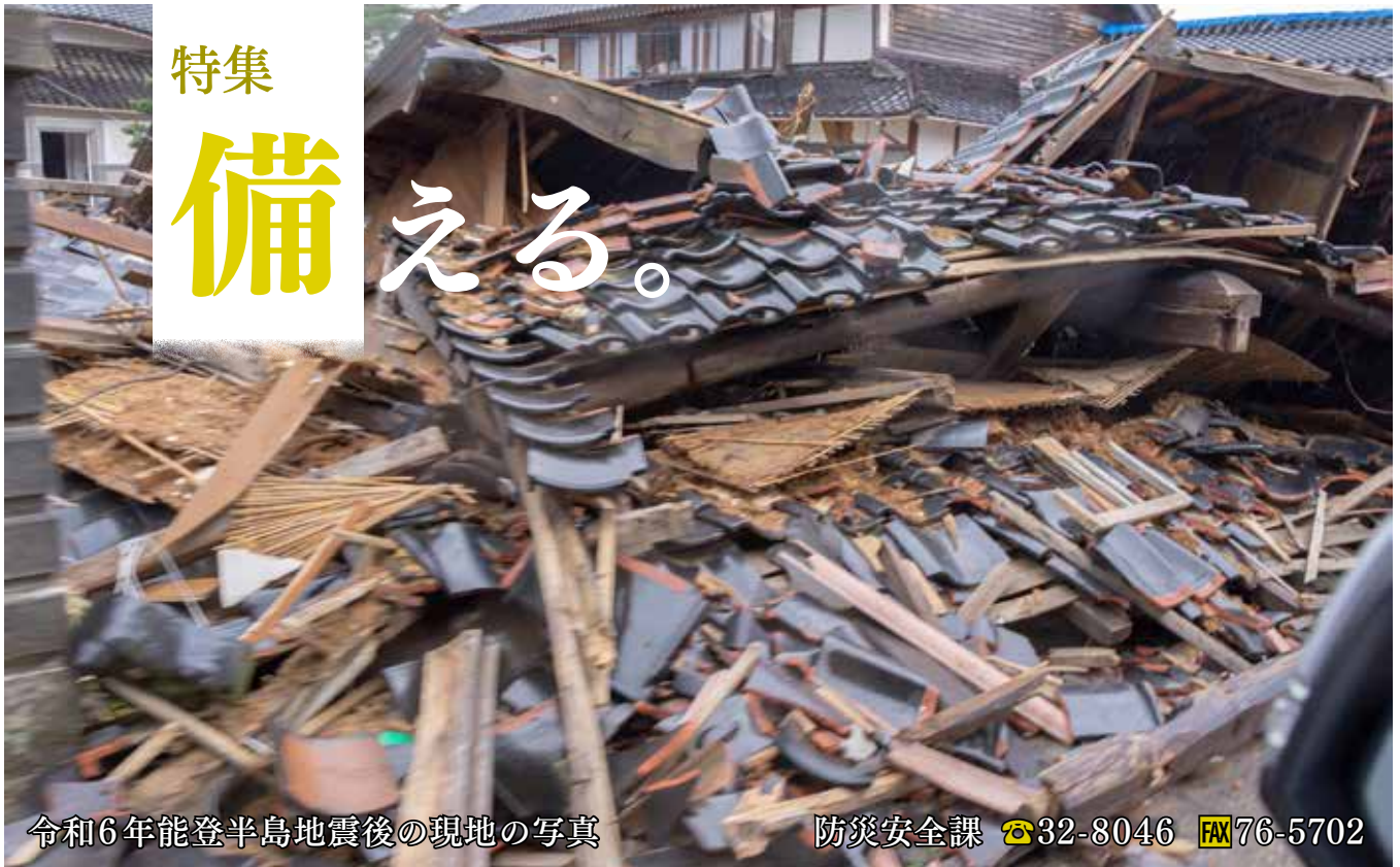
令和6年能登半島地震後の現地の写真