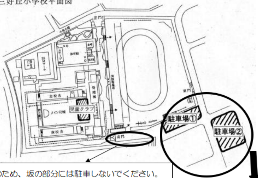
三好丘小学校平面図