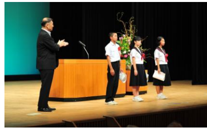
男女共同参画川柳 受賞者のみなさん

今後、ご家族や友人の間でも、男女共同参画について話題にしていだけたらと思います。