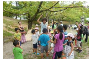
男女共同参画講座 「もりおくと 森いっちゃお！」より

プレーパークとは、なるべく禁止事項をなくして、活動 に賛同した人たちが自主的に作る住民参加型の遊び場 です。コマ、けん玉、スラックライン、探検、芝すべり、の こぎり工作、鬼ごっこ…子どもは遊びの中で挑戦・失敗を くりかえして成長していきます。0歳から120歳まで プレーパークで「自分時間」を楽しもう！