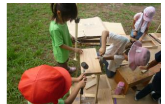
3人力を合わせて机作り