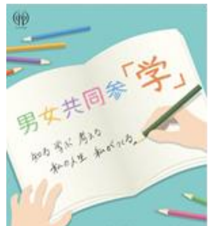
令和元年度男女共同参画キャッチフレーズ