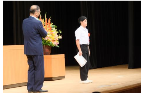
男女共同参画川柳 表彰式

講演では、「人生100年時代の今、第2の人生計画を立てましようというお話に共感しました」「男女がお互い支え合って、毎日楽しく過ごしていきたいと思いました」映画では、「痛ましいニュースが多い昨今、主人公と女の子が本当の家族のような絆で結ばれていくお話にホッとした気持ちになりました」といった感想をいただきました。今後、ご家族や友人の間でも、男女共同参画について話題にしていただけたらと思います。