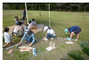
「ノコギリだってお手の物」