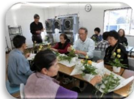
交流会で人気の「フラワーアレンジメント」