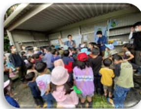
捕まえた水中の生き物の説明を真剣に聞いているところ