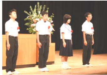
2階ロビーに 展示された 川柳の表彰作品