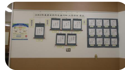
↑イオン三好店1階パブリックスペース