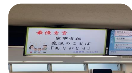
↑みよし市役所市民課前電子案内表示版