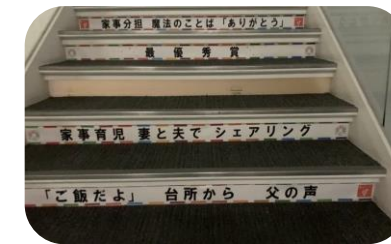
↑みよし市役所1階2階吹き抜け階段