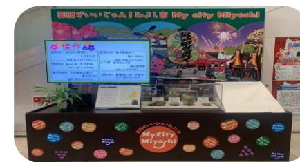
↑サンライブ内シティープロモーションモニター