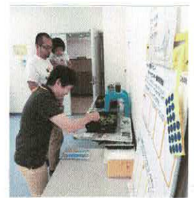
▲アンケートに答えていただきました。