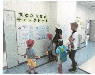
▲チェックシートに取り組む親子