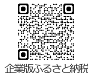
企業版ふるさと納税