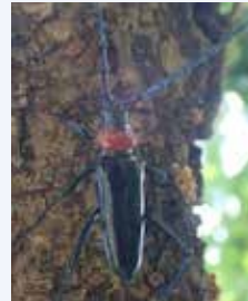
▲クビアカツヤカミキリ

モモ・サクラ・ウメの木を好んで食べるクビアカツヤカミキリが全国的に増えています。被害に気付かず放置すると虫の数が増え、木は枯れ、周囲にも被害が拡大します。クビアカツヤカミキリは写真のように独特な見た目をしており、被害に遭った木は、周りに大量の木くず(フラス)がたまりやすくなります。クビアカツヤカミキリは特定外来生物に指定されており、生きたままの持ち運びは禁止されています。成虫やフラスを見つけた場合は、生活環境課までご連絡ください。