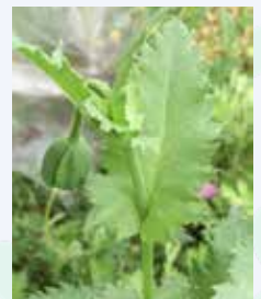
▲葉の付け根が茎を抱き込んでいる様子