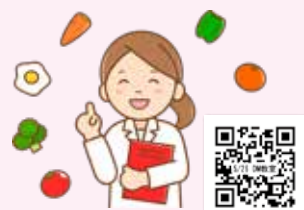
5月26日分 申し込みフォーム