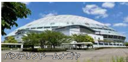
バンテリンドームナゴヤ

内容 ナゴヤ球場での練習見学、バンテリンドームナゴヤでの試合観戦(ジャイアンツ戦)など(バスで移動)