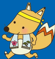
みよし市健康づくり大使 「キューちゃん」