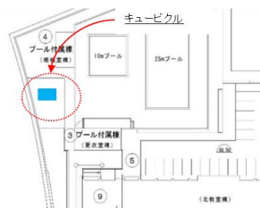
三好丘小学校配置図抜粋