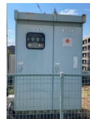
三好丘小学校受変電設備現況写真