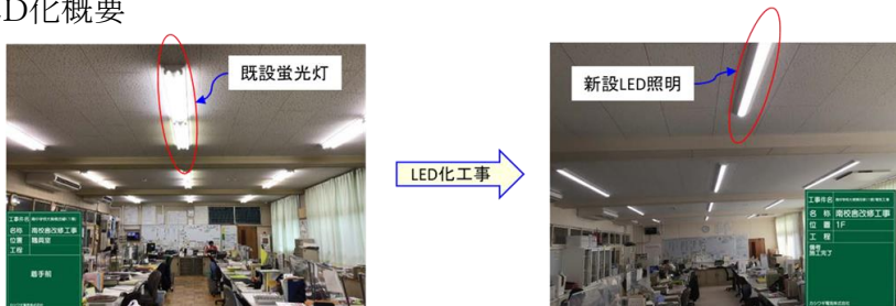
(参考)南中学校の職員室で大規模改修内で実施したLED化工事