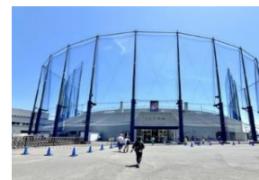
ナゴヤ球場 (現中日ドラゴンズファーム拠点)