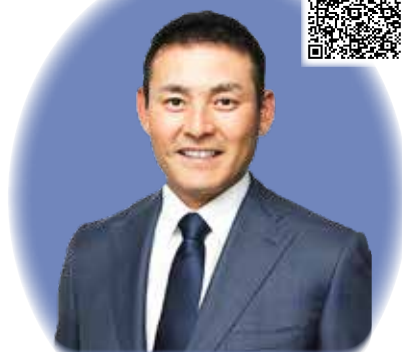
▲かわかみけんしん 川上憲伸さん (元中日ドラゴンズ)