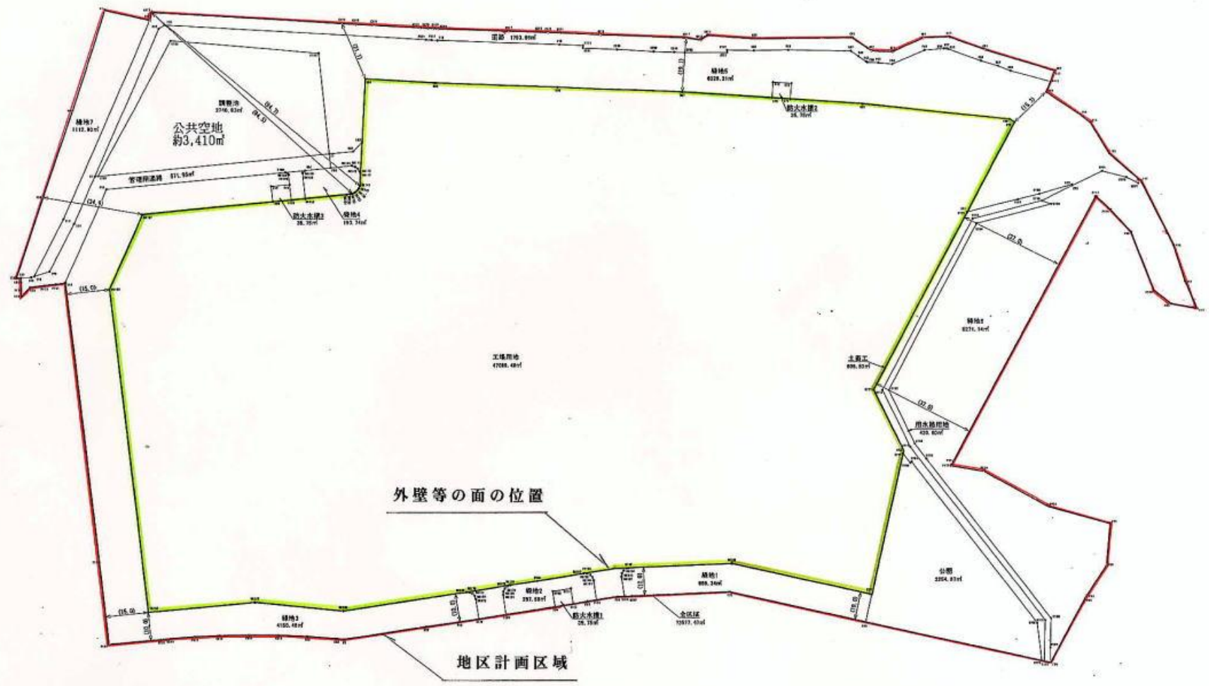
壁面の位置の制限図